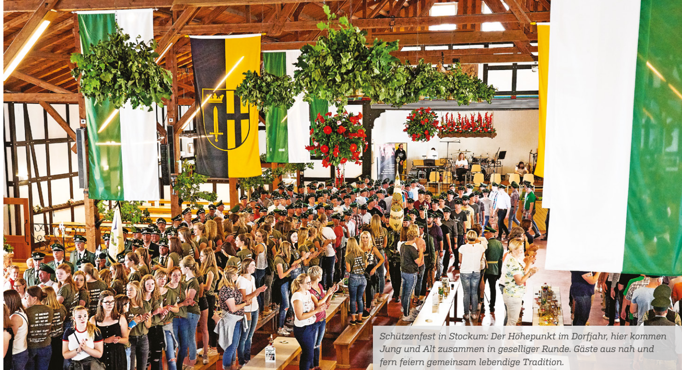
Schützenfest in Stockum: Der Höhepunkt im Dorfjahr, hier kommen Jung und Alt zusammen in geselliger Runde. Gäste aus nah und fern feiern gemeinsam lebendige Tradition.